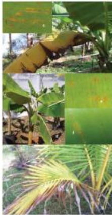
Fig. 3. Symptoms of damage by Raoiella indica on experimentally infested host plants. Tabasco, Mexico, after 8 months of infestation. Dwarf Giant banana (a-c), Horn plantain (d-e), Date banana (f). Yellowish-brown necrotic spots caused by colonies of mites on abaxial surface of Musa spp. plant leaves (c, e, f).

Se evaluó en campo la aplicación de insecticidas sobre M. sacchari en sorgo, con diferente modo de acción, cada uno de ellos en dos experimentos que mantuvieron la densidad por abajo del umbral económico establecido de 50 pulgones por hoja. A los 28 días después de la aplicación, imidacloprid, sulfoxaflor, flupyradifurone, pymetrozine, spirotetramat y afidopyropen presentaron las menores densidades de pulgón amarillo. Esta información es relevante, ya que conocer la efectividad de insecticidas con diferente modo de acción, permite utilizar los más efectivos y que puedan integrarse con otras medidas que se implementen en el manejo de M. sacchari .