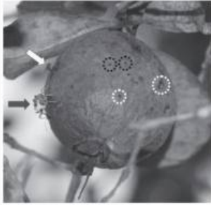
Fig. 1. Acca sellowiana fruit showing characteristic symptoms of Conotrachelus psidii attack: damage caused by feeding (black circles) and oviposition (white circles). An adult male of C. psidii is indicated by a black arrow, and an egg-laying adult female of Drosophila sp. is indicated by a white arrow.