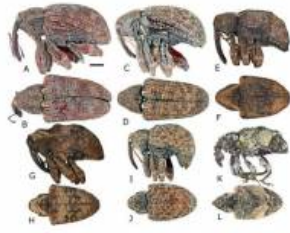
Fig. 1. Lateral and dorsal view of male. A and B) C. pensan ; C and D) C. apulcar ; E and F) C. dimidiatus ; G and H) C. crotaegi ; I and J) C. eburneus ; K and L) C. eburneus . Scale bar 1 mm.