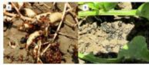
Figura 4. Comportamiento de gusano Alvarado, El albarito

El Servicio Nacional de Calidad y Sanidad Vegetal y de Semillas (SENAVE) de Paraguay, declaró emergencia fitosanitaria debido a la presencia de la langosta voladora ( Schistocerca cancellata ), para los departamentos de Alto Paraguay y Boquerón, departamentos donde se detectaron 9 focos de ataque de langosta. La Emergencia Fitosanitaria, establece un periodo de 60 días para realizar acciones que comprenden monitoreos permanentes, tomas de muestras entomológicas y aplicaciones de productos fitosanitarios, con el objetivo de prevenir la formación mangas, evitando que la langosta se disperse a otras zonas.